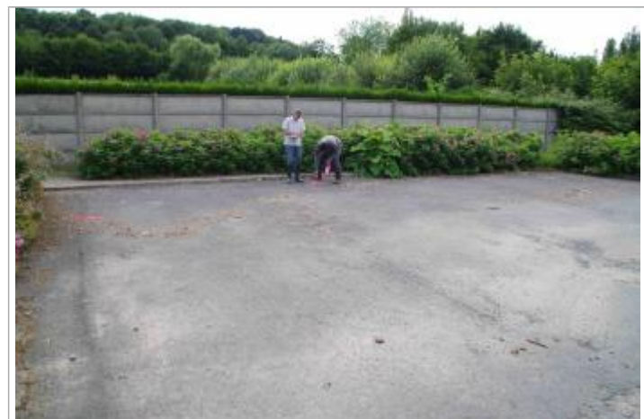
Vue des deux marque peintes laissées pour garder la limite de la zone inondée