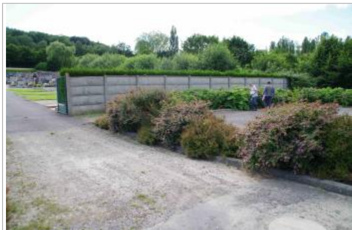
Vu sur le parking à droite en face de l'entrée du cimetière