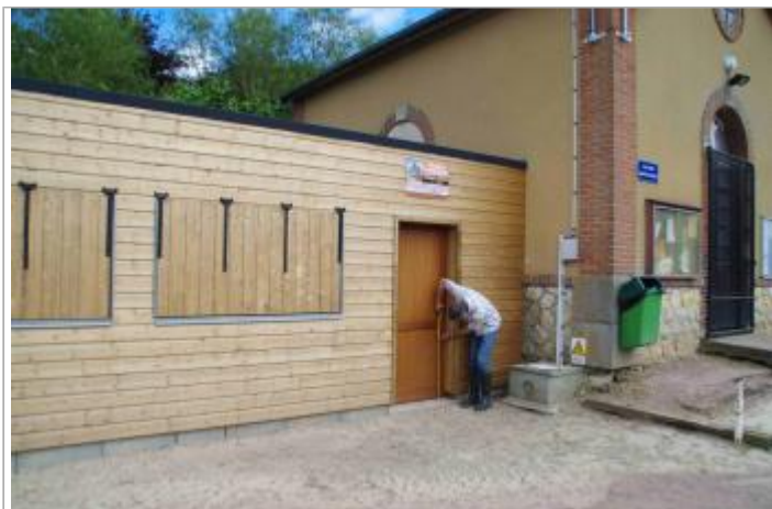
Annexe du local du Boulodrome