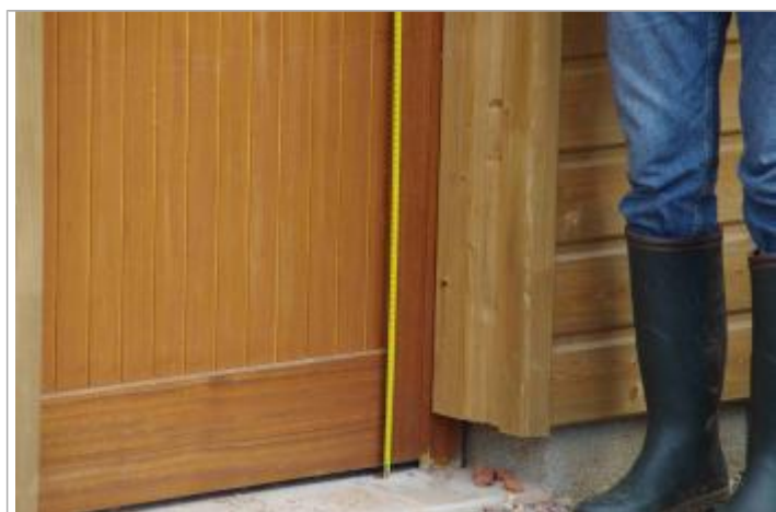
Laisse temporaire laissée sur la porte en bois et marquée au crayon

Altitude calculée de l'eau (en m) : 96.725 m