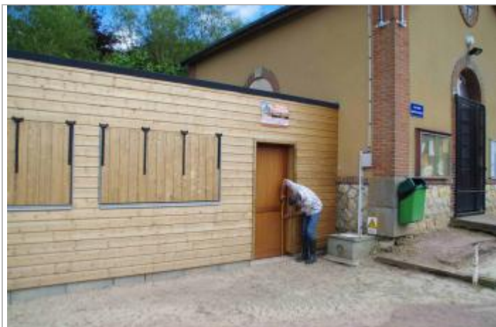
Annexe du local du Boulodrome