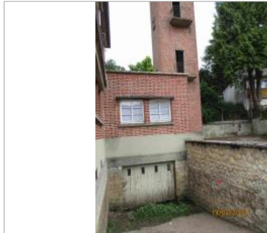
Vue générale de la descente de garage - prise de la photo de la rue R. Gerhard Buchling