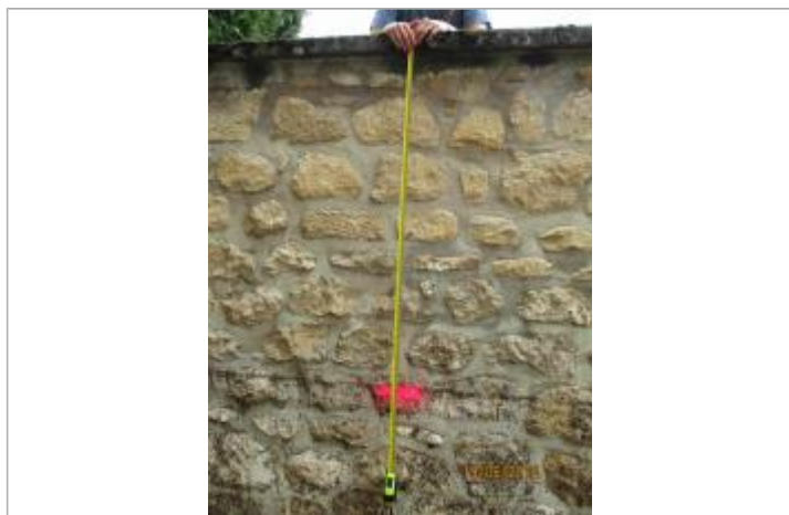
Laisse de crues sur le mur en pierre dans la descente de garage

Maximum de l'inondation : Oui Visibilité : Oui État du repère : Bon Pérennité : Moyenne