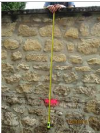
Laisse de crues sur le mur en pierre dans la descente de garage

Altitude calculée de l'eau (en m) : 100.14 m