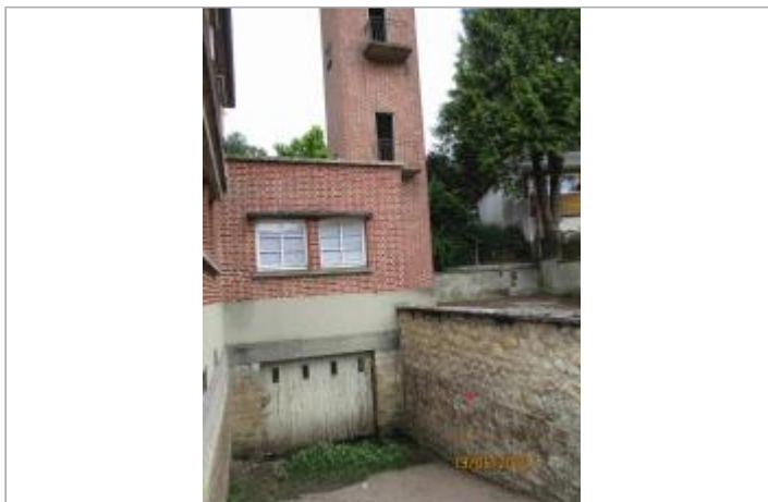
Vue générale de la descente de garage - prise de la photo de la rue R. Gerhard Buchling