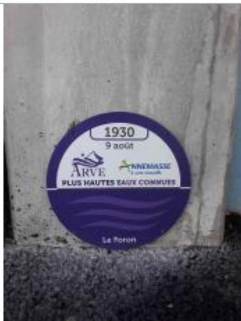
crue du Foron le 9 août 1930