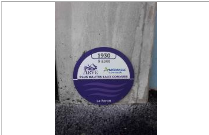
crue du Foron le 9 août 1930