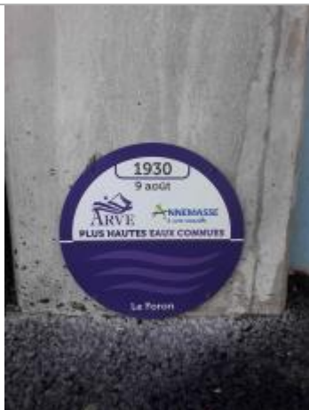
crue du Foron le 9 août 1930