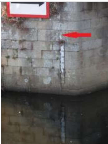
Echelle aval de l'écluse des Recollets à Pontivy

Altitude calculée de l'eau (en m) : 55.96 m