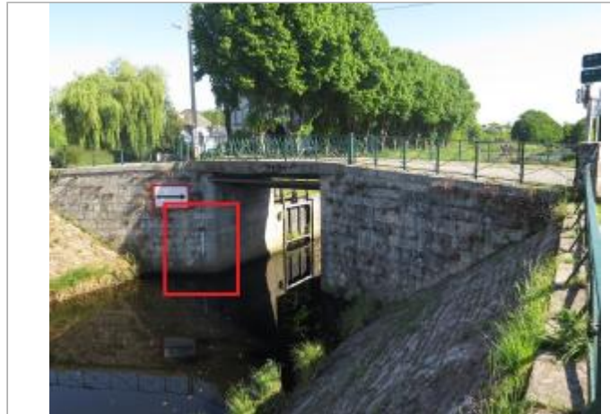
Aval de l'écluse des Recollets à Pontivy

Coordonnées WGS84 : X: -2.96639680 / Y: 48.07028750