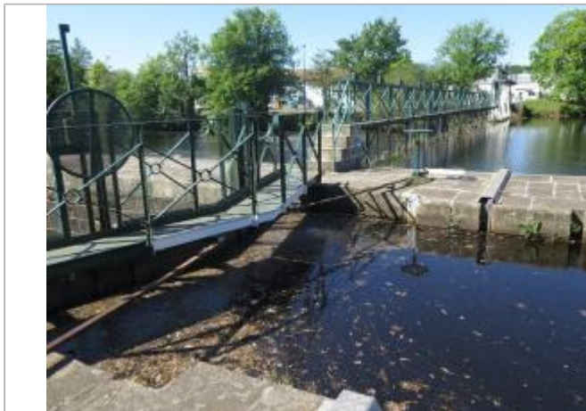
Amont de l'écluse de Lestitut à Pontivy