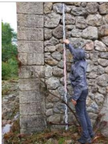
vue laisse et mesure

Différence entre le niveau d'eau et la référence (en m) : 2.300 m