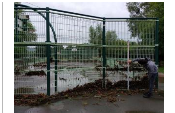
vue laisse et mesure

GÉNÉRAL Code : ARD2021_R_24_1 Date de mise à jour : 12/09/2022 Auteur : EPTB Ardèche