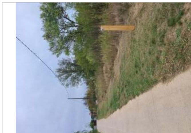
Totem de crue au bord de la piste cyclable