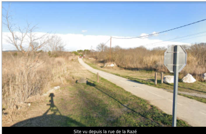
Site vu depuis la rue de la Razé