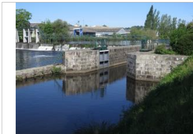
Echelle aval disparue de l'écluse de Lestitut à Pontivy

Altitude calculée de l'eau (en m) : 54.12 m