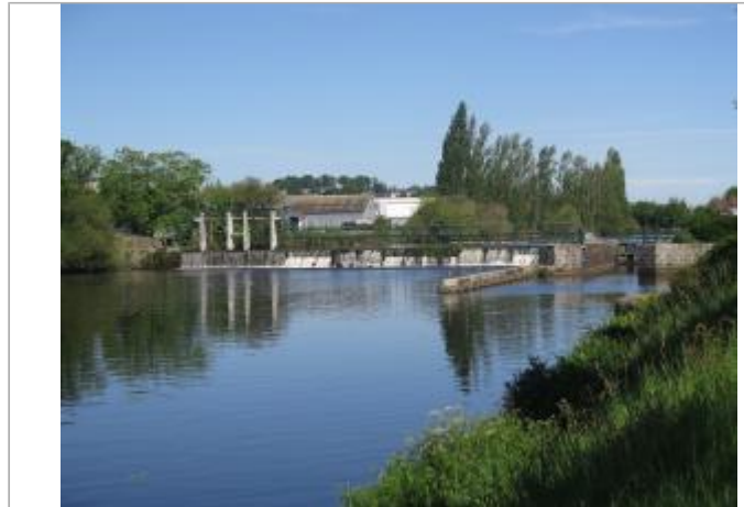
Aval de l'écluse de Lestitut à Pontivy

Coordonnées WGS84 : X: -2.96103580 / Y: 48.05264300