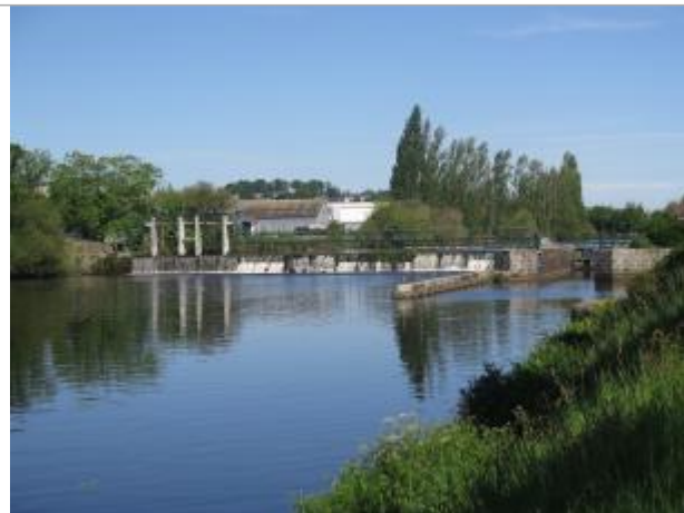
Aval de l'écluse de Lestitut à Pontivy