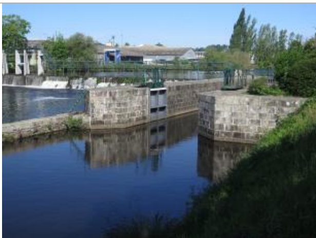
Echelle aval disparue de l'écluse de Lestitut à Pontivy

Altitude calculée de l'eau (en m) : 53.99 m