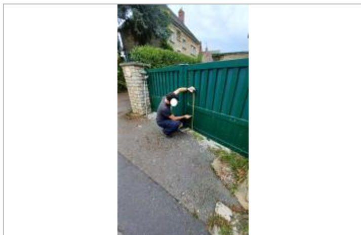
Laisse de crue sur le portail

Altitude calculée de l'eau (en m) : 99.66