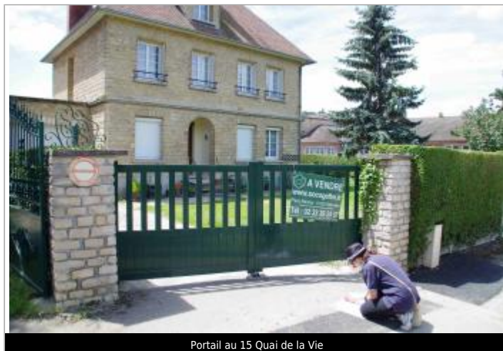
Portail au 15 Quai de la Vie