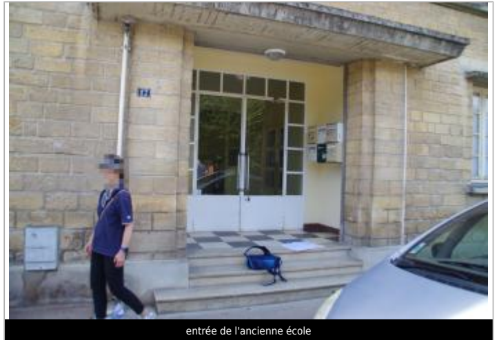
entrée de l'ancienne école

Coordonnées WGS84 : X: 0.19955082 / Y: 48.92754290