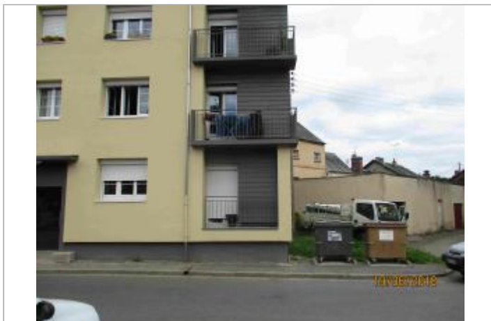
Façade de l'immeuble situé 1 rue la Cité des Prés des Gâteaux