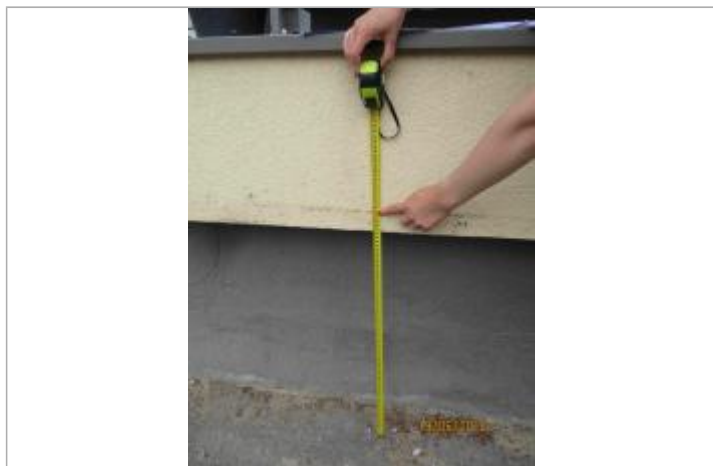
Mesure de la marque au niveau de l'immeuble à partir du trottoir

Altitude calculée de l'eau (en m) : 100.14 m