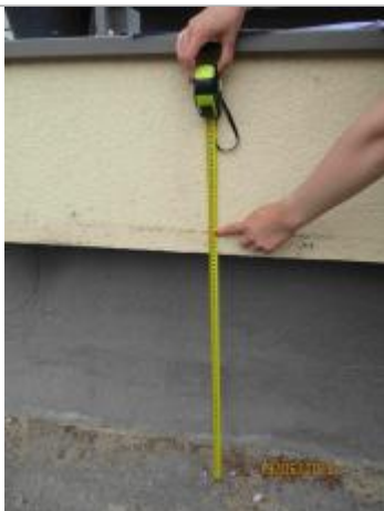
Mesure de la marque au niveau de l'immeuble à partir du trottoir

Altitude calculée de l'eau (en m) : 100.14