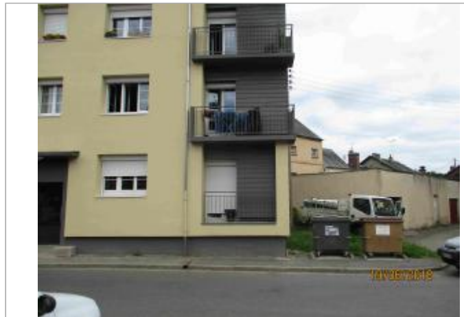
Façade de l'immeuble situé 1 rue la Cité des Prés des Gâteaux

Coordonnées WGS84 : X: 0.19896028 / Y: 48.92576400