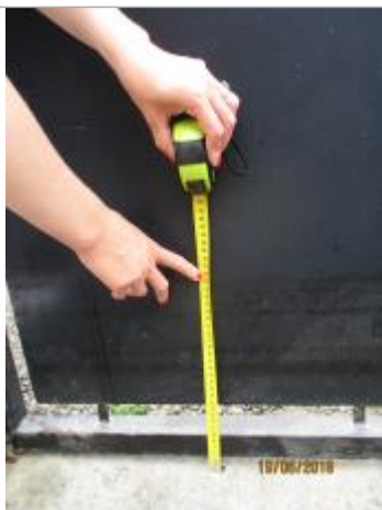
Mesure de la laisse par rapport à la dalle en béton du portail

Altitude calculée de l'eau (en m) : 99.63 m