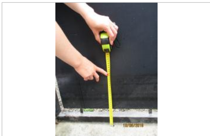
Mesure de la laisse par rapport à la dalle en béton du portail

Altitude calculée de l'eau (en m) : 99.63 m