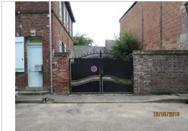
Portail noir en fer forgé du 2 rue Lafayette