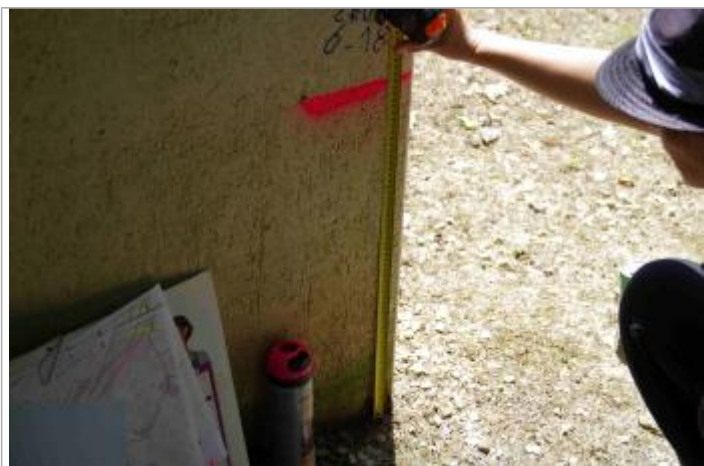
marque de peinture rose sur le mur de la maison

Altitude calculée de l'eau (en m) : 97.875 m