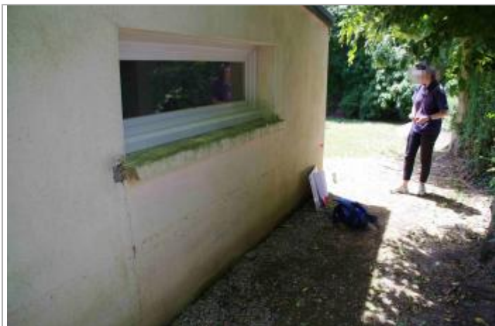
coin de la maison longeant allée