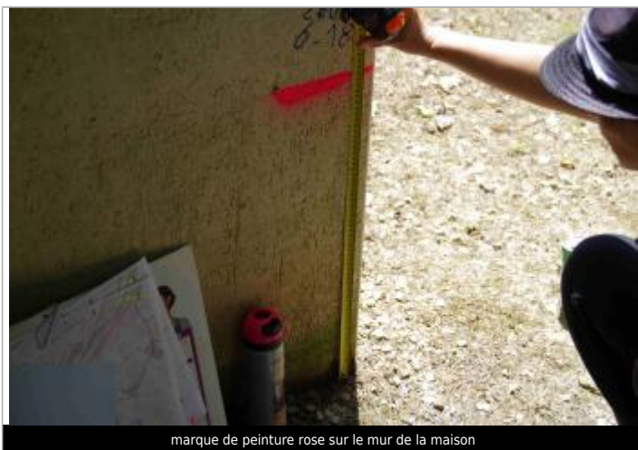
marque de peinture rose sur le mur de la maison

Méthode : Méthode combinée Référence nivelée : Autre type de référence Description référence du repère : Sol au pied du mur. Système altimétrique : NGF IGN 1969 (système normal) Altitude de la référence (en m) : 97.250 m Différence entre le niveau d'eau et la référence (en m) : 0.625 m Altitude calculée de l'eau (en m) : 97.875