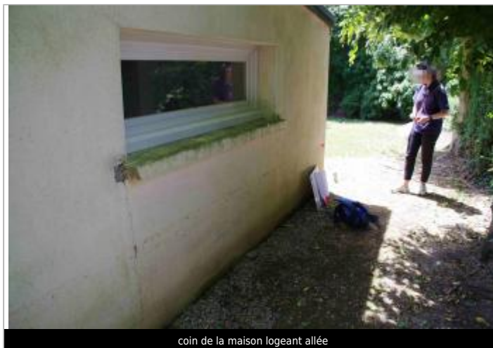
coin de la maison longeant allée