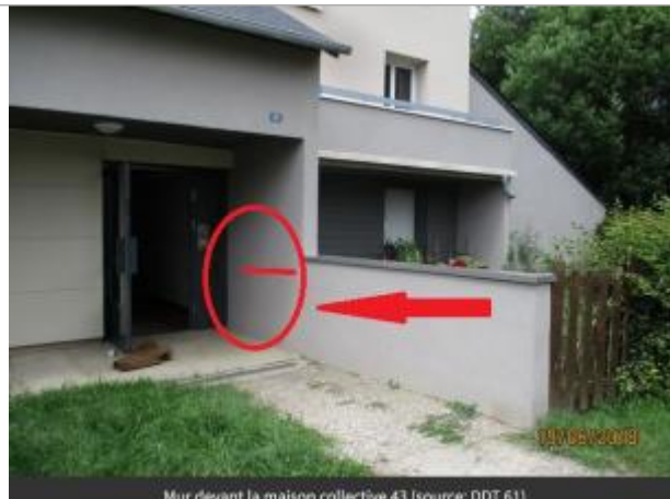
Mur devant la maison collective 43