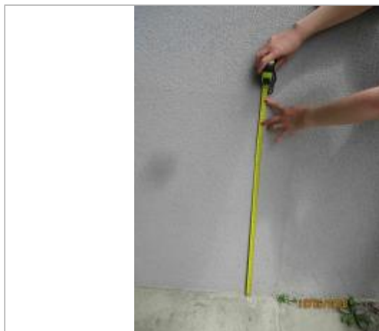
Prise de mesure à partir du seuil en béton proche de la porte d'entrée de la maison collective

Altitude calculée de l'eau (en m) : 100.66 m