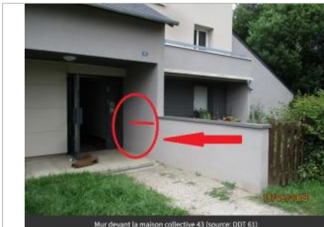
Mur devant la maison collective 43