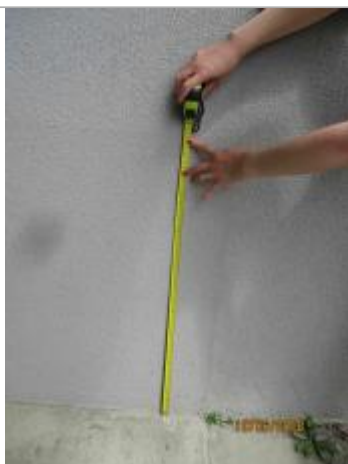
Prise de mesure à partir du seuil en béton proche de la porte d'entrée de la maison collective

Altitude calculée de l'eau (en m) : 100.66 m