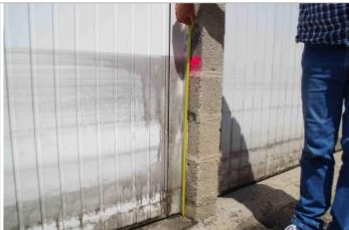
marque de peinture rose sur le mur entre 2 garages à 85 cm/sol.