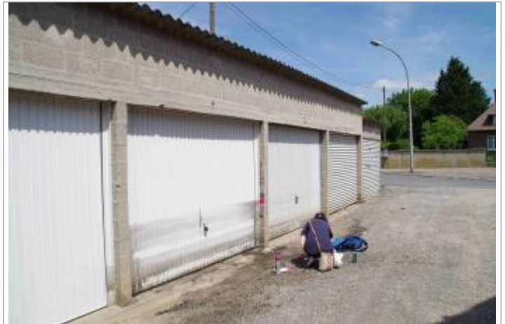
allée privée avec succession de garages