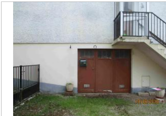
Vue de la porte de garage

Coordonnées WGS84 : X: 0.20230017 / Y: 48.92160900