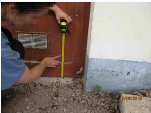
Mesure de la marque au niveau de la porte de garage à 25 cm/sol

Altitude calculée de l'eau (en m) : 101.51