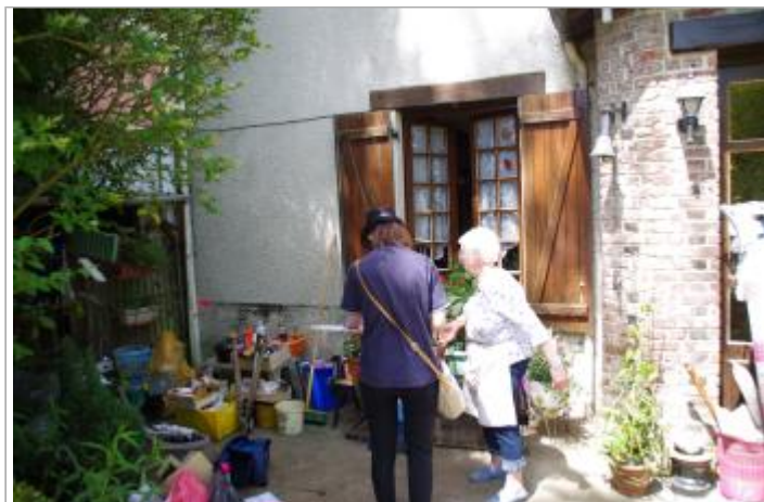
mur de façade de la maison