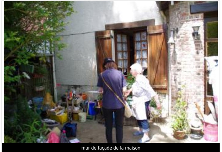
mur de façade de la maison