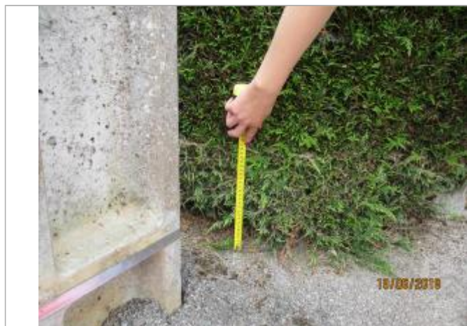
Mesure prise au niveau de la haie, à côté du poteau électrique

Altitude calculée de l'eau (en m) : 101.41 m