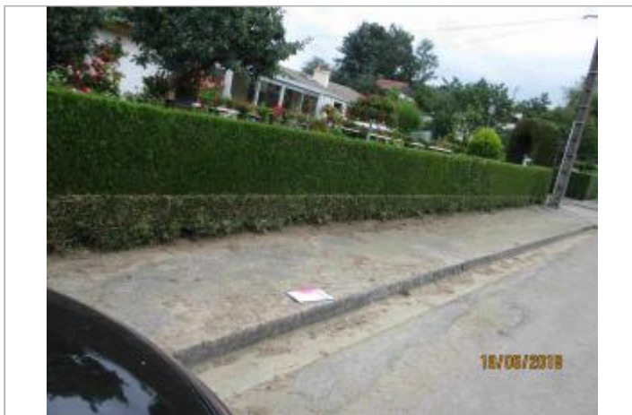
Haie côté rue de la propriété 7 rue de Sontra