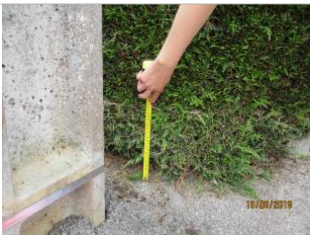
Mesure prise au niveau de la haie, à côté du poteau électrique (source : DDT 61)

Altitude calculée de l'eau (en m) : 101.41