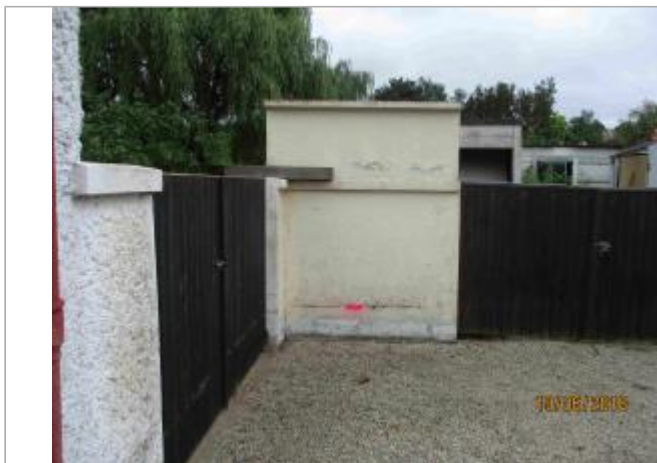
Vue du mur depuis la cour de la copropriété