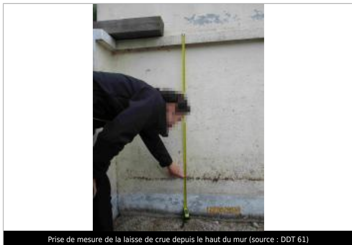
Prise de mesure de la laisse de crue depuis le haut du mur (source : DDT 61)

Altitude calculée de l'eau (en m) : 101.43 m