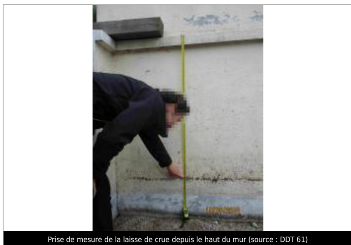
Prise de mesure de la laisse de crue depuis le haut du mur (source : DDT 61)

Méthode : GPS Commentaires sur le nivellement : Précision instrument: +/- 1 cm. Référence nivelée : Autre type de référence Description référence du repère : Sol au pied du mur. Système altimétrique : NGF IGN 1969 (système normal) Altitude de la référence (en m) : 101.100 m Différence entre le niveau d'eau et la référence (en m) : 0.330 m Altitude calculée de l'eau (en m) : 101.43