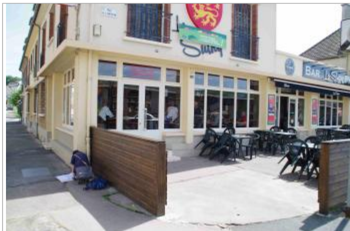
coin de la maison du bar le Sulky entre la rue du Perré et de la rue de la Libération