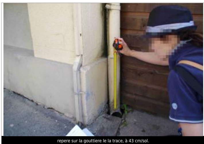
repere sur la gouttiere le la trace, à 43 cm/sol.

Altitude calculée de l'eau (en m) : 99.52