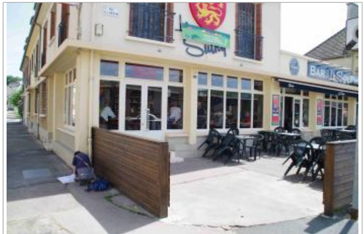
coin de la maison du bar le Sulky entre la rue du Perre et de la rue de la Liberation