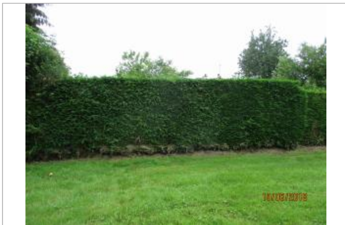
Vue de la haie depuis le parcours de santé