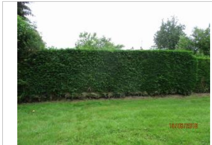
Vue de la haie depuis le parcours de santé

Coordonnées WGS84 : X: 0.20241206 / Y: 48.92135200