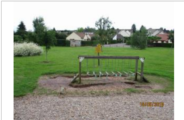
Vue générale du pont suspendu du parcours de santé