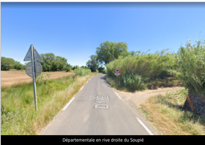
Départementale en rive droite du Soupié

GÉOLOCALISATION Coordonnées WGS84 : X: 3.51490760 / Y: 43.40526400 Coordonnées RGF93 (Lambert 93) X: 741729.48 / Y: 6256374.36 Coordonnées RGF93 (ETRS89) : X: 3.5149076 / Y: 43.405264 Code Hydro: Y3000540 Rive de référence: