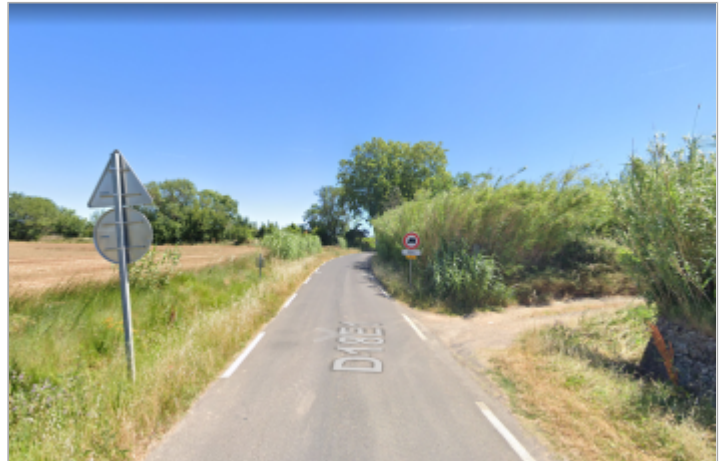
Départementale en rive droite du Soupié

Coordonnées WGS84 : X: 3.51490760 / Y: 43.40526400