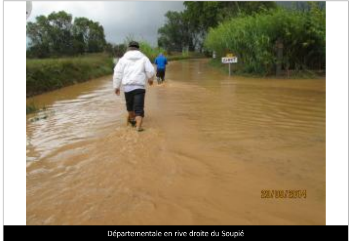
Départementale en rive droite du Soupié

RELEVÉS GPS - 13/07/2022 Méthode : GPS Commentaires sur le nivellement : L'altimétrie atteinte est la même en rive droite. Référence nivelée : Autre type de référence Description référence du repère : TN de la route au niveau du panneau "Pinet" Système altimétrique : NGF IGN 1969 (système normal) Altitude de la référence (en m) : 19.800 m Différence entre le niveau d'eau et la référence (en m) : 0.800 m Altitude calculée de l'eau (en m) : 20.6 m