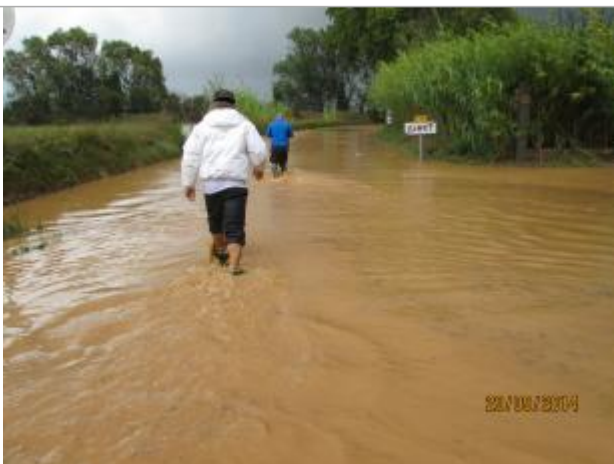
Départementale en rive droite du Soupié

Altitude calculée de l'eau (en m) : 20.6 m