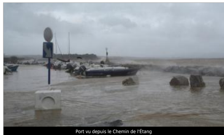
Port vu depuis le Chemin de l'Étang