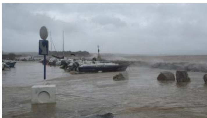
Port vu depuis le Chemin de l'Étang