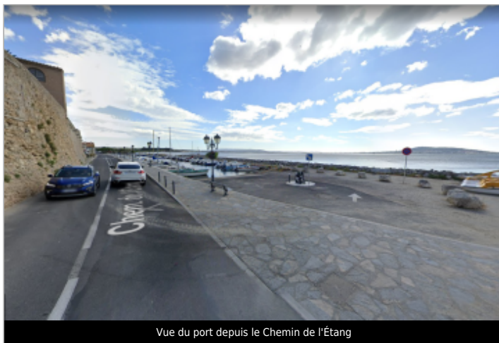
Vue du port depuis le Chemin de l'Étang