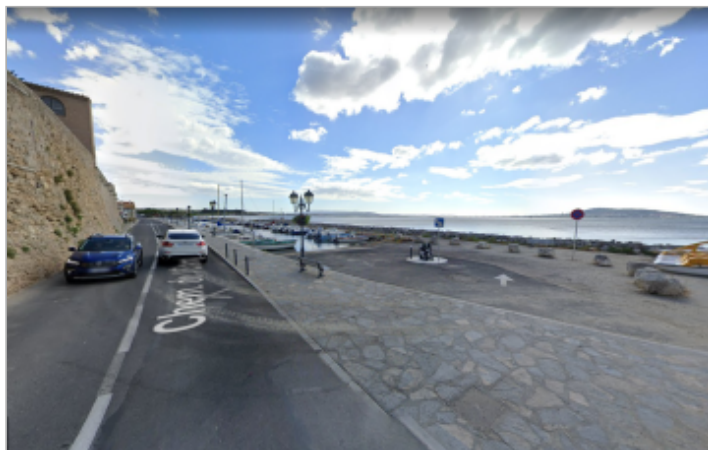
Vue du port depuis le Chemin de l'Étang