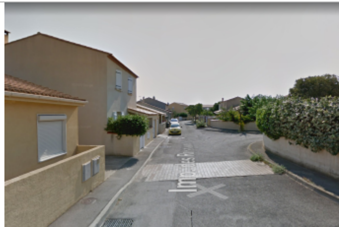
Entrée de l'impasse depuis la route de Montpellier