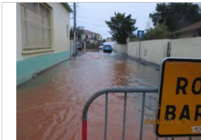
Partie haute de la rue

Altitude calculée de l'eau (en m) : 1.45 m