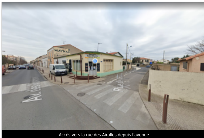
Accès vers la rue des Airoilles depuis l'avenue