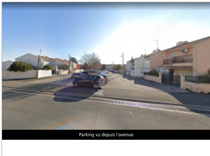
Parking vu depuis l'avenue