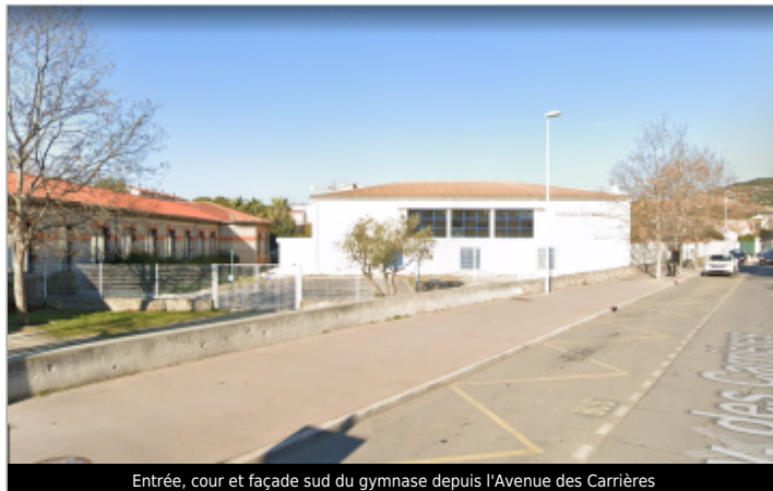
Entrée, cour et façade sud du gymnase depuis l'Avenue des Carrières

Coordonnées WGS84 : X: 3.75431770 / Y: 43.44970500