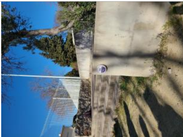
Repère de crue au niveau du portail du gymnase

Altitude calculée de l'eau (en m) : 5.3 m