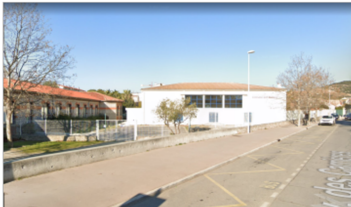
Entrée, cour et façade sud du gymnase depuis l'Avenue des Carrières