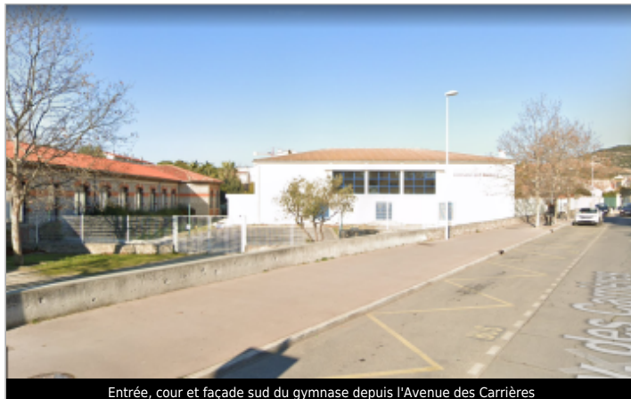
Entrée, cour et façade sud du gymnase depuis l'Avenue des Carrières