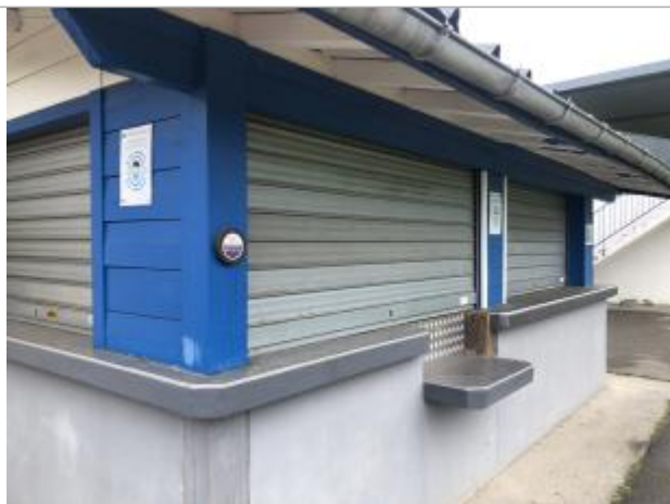
Repère sur le pilier Ouest de la buvette