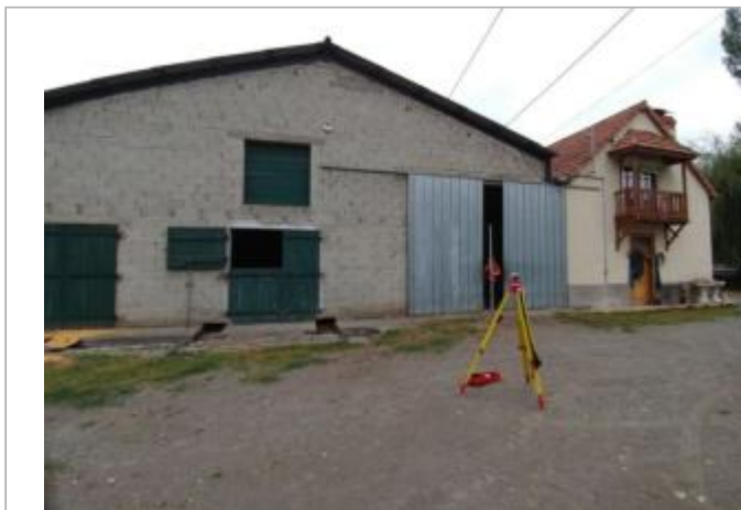
Levée de la laisse côté sud du bâtiment