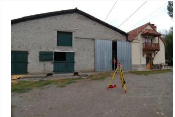
Levée de la laisse côté sud du bâtiment

Coordonnées RGF93 (ETRS89) : X: -0.0867372 / Y: 42.9939679