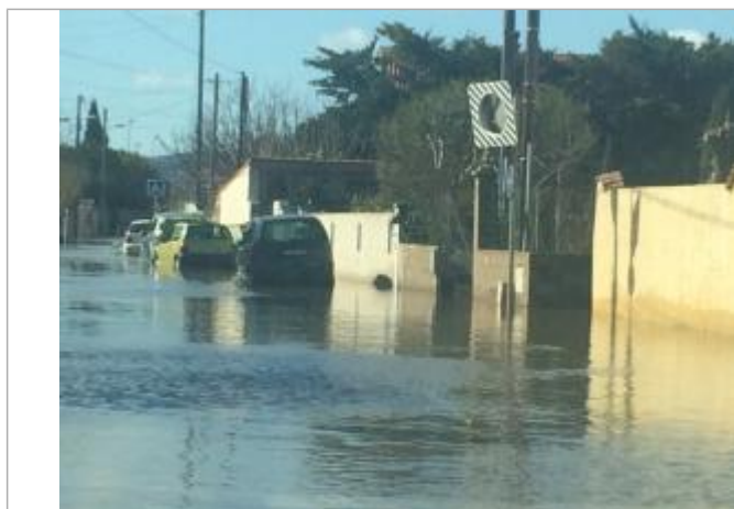
Rue des Près Saint-Martin côté rue Gounod