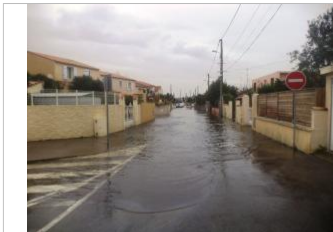
Entrée de la rue côté Rue de la Gendarmerie

Altitude calculée de l'eau (en m) : 0.95 m