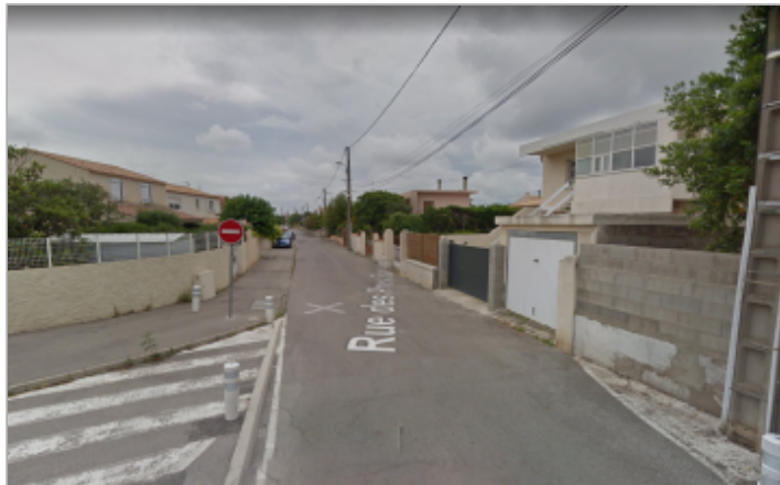
Rue depuis la Rue de la Gendarmerie