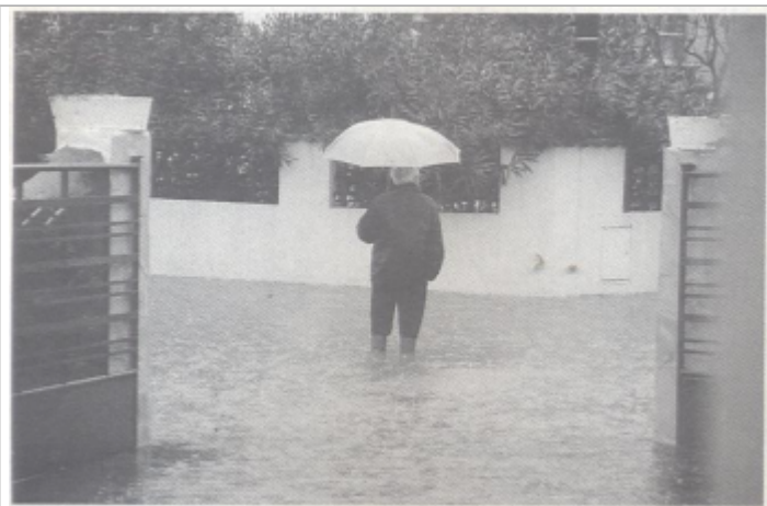
Rue devant le n°35