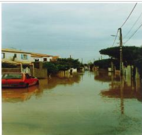
Entrée de la rue côté Rue de la Gendarmerie #1

Altitude calculée de l'eau (en m) : 0.95