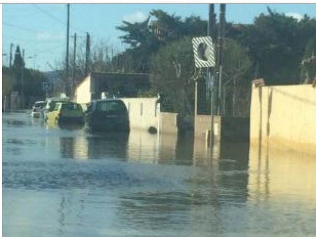
Rue des Près Saint-Martin côté rue Gounod

Altitude calculée de l'eau (en m) : 1.05