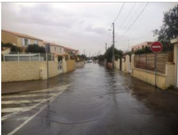
Entrée de la rue côté Rue de la Gendarmerie

Altitude calculée de l'eau (en m) : 0.95