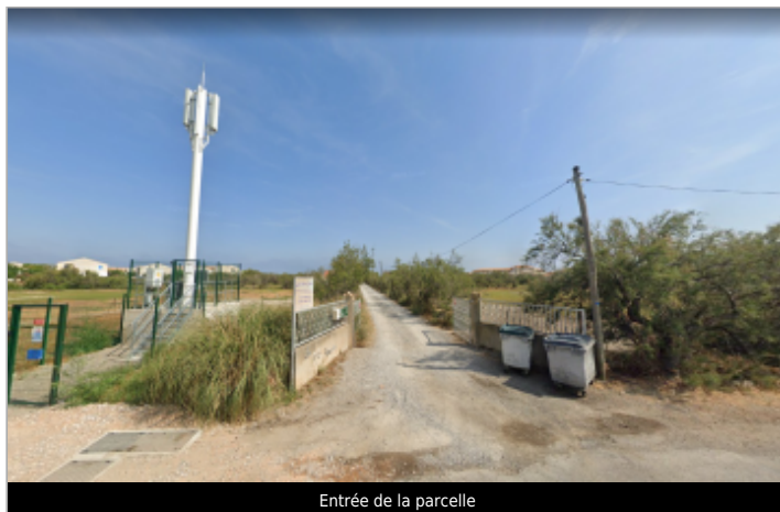
Entrée de la parcelle