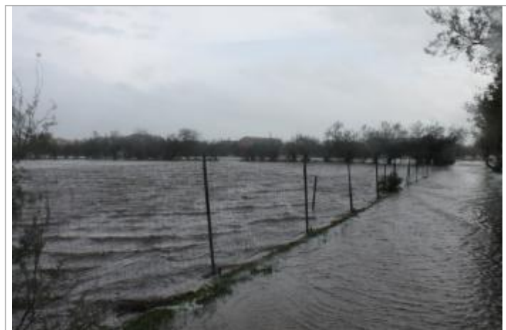
Parcelle depuis l'impasse des Puffins