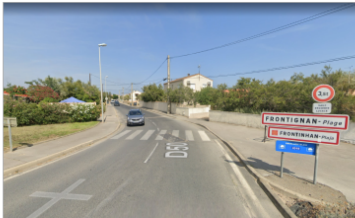
Entrée sud de l'avenue depuis le rond-point

Coordonnées WGS84 : X: 3.79229330 / Y: 43.44128500