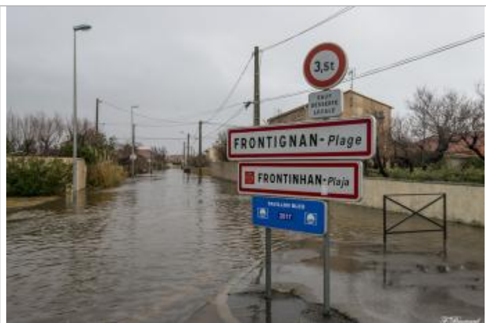
Entrée de l'avenue depuis le rond-point

Altitude calculée de l'eau (en m) : 0.85 m