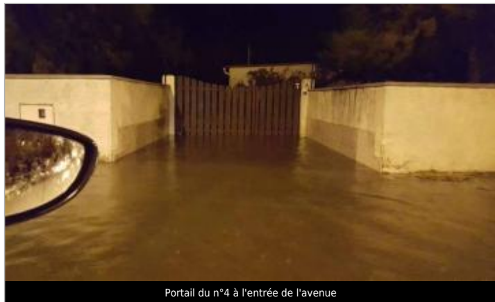
Portail du n°4 à l'entrée de l'avenue